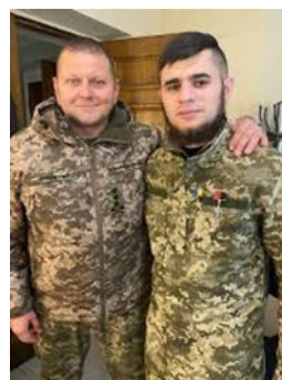
Le Général Zaluzhny, nommé par Zelenski en juillet 21, reçoit le jeune nazi décoré