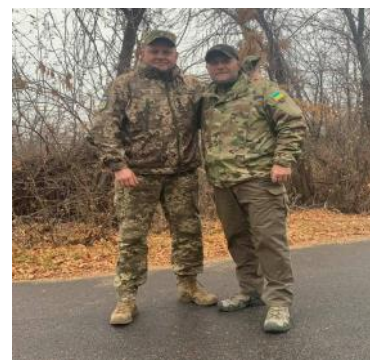
Le même Général, au côté de Iarosh, le lendemain de sa nomination par Zelenski