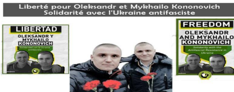
Ces deux frères sont deux militants communistes arrêtés par les services secrets ukrainiens récemment.

Lui qui laisse se développer un révisionnisme historique délirant dans son pays, trouvant dans une émission de télévision que le culte ukrainien de Bandera (un SS ukrainien) « c'est cool ». Tout l'héritage antifasciste de l'URSS est détruit minutieusement, et remplacé par la glorification de Bandera et d'autres nazis ukrainiens. Lui qui maintient l'interdiction du parti communiste, emprisonne des camarades et vient d'interdire 11 partis d'opposition.