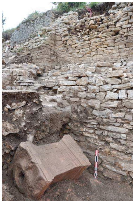
Un « rocher monument ». Un nouveau lieu de pouvoir et de puissance dans le Gévaudan du haut Moyen Age.

des déblaiements à réaliser, sur près de 4m de hauteur, a restreint les sondages à de petites surfaces, d'autre part les données recueillies ne sont pas toutes encore traitées. L'une des questions centrales, encore non résolue, est de comprendre si l'on se trouve dans une partie souterraine, ou semi-enfouie, crypte ou hypogée. [Page 327]. La publication de la CAG48 nous offre néanmoins l'occasion de signaler dès à présent que le sondage de 10m 2 réalisé à l'extrémité du volume NE a permis de mettre en évidence une chambre réduite et de découvrir dans un contexte chronologique qui est toujours celui des VI-VIIe s., deux fragments d'os humain et un cippe antique retourné et disposé au centre de la pièce (Fig.408).