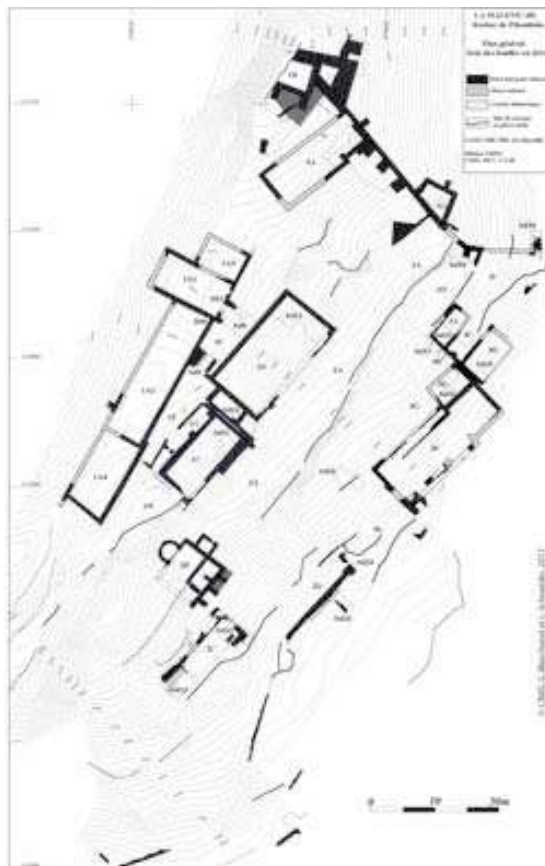
[Plan page 319, figure 392]

gestion des déblais impose d'inscrire le projet scientifique dans un projet plus général d'aménagement et de valorisation du lieu.